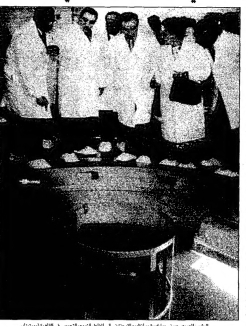
عميد صلاح الدين - (يمين) والوزير الإسرائيلي حاييم باراك - (يسار) بعد توقيع الاتفاقية النووية...

في اشارة الى اسرائيل الراضية لاي رقابة من هذا النوع